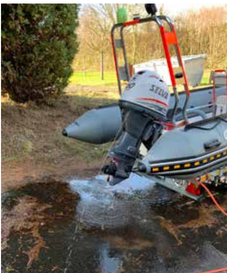
Bootswartung (links), neues Material (rechts)

Ebenso wollen wir uns wieder mehr an Wasserrettungsdiensten bei Sportveranstaltungen im gesamten Landesverband beteiligen und dort auch mit unserem Boot vermehrt in den Einsatz gehen.