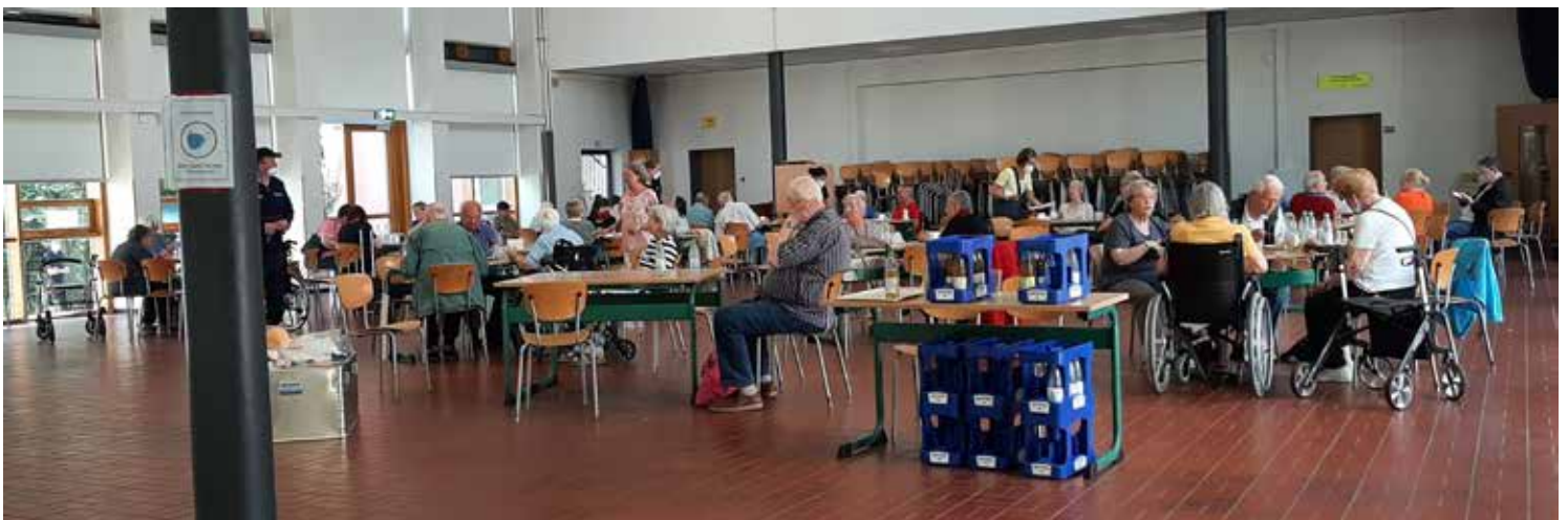
Einsatz Bombenfund in Aachen-Burtscheid, Verpflegung)

Aufgrund des stetig wachsenden Zustroms wurde gegen 10:30 Uhr beim Stab eine weitere Betreuungsstaffel nachgefordert. Die Kameraden der Malteser, die in der Michaelsbergstraße eine weitere Betreuungsstelle vorbereitet hatten, rückten daraufhin zum Gillesbachtal ab. In der Folge übernahmen sie den Einsatzabschnitt soziale Betreuung und unterstützten im Sanitätsbereich. Unsere Kräfte besetzten weiterhin die Registrierung und den nun abgegrenzten Einsatzabschnitt Verpflegung. Dank des guten Wetters nutzte ein Teil der Personen auch den angrenzenden Schulhof für den Aufenthalt.