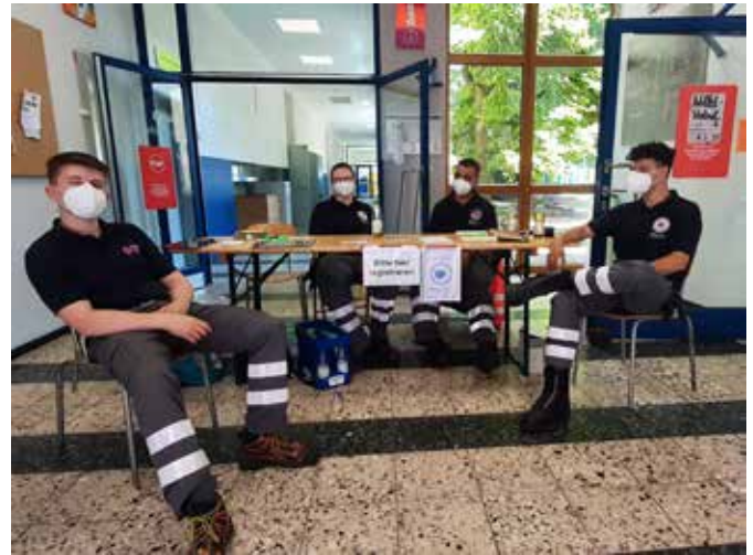
Einsatz Bombenfund in Aachen-Burtscheid, Material (links) und Registrierung (rechts)

vorbereitet. Außerdem wurden ein Ruhe-, ein Still-, sowie ein Sanitätsraum eingerichtet.