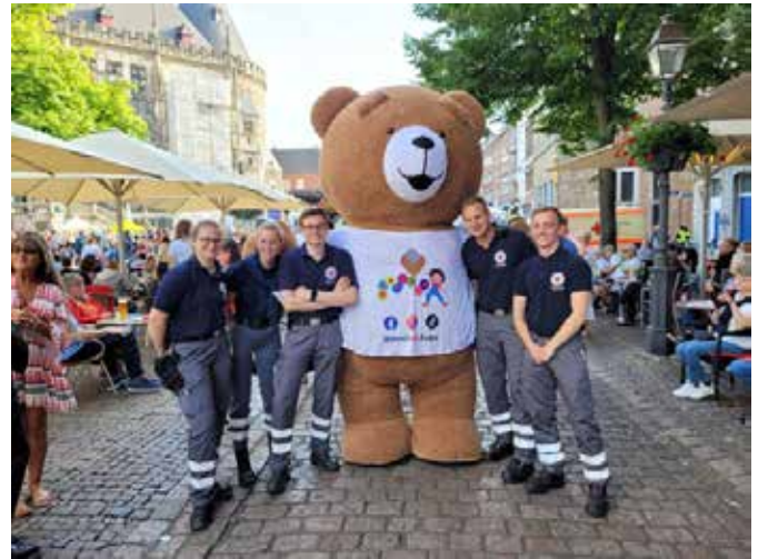
Einsatz auf dem Markt bei der NRW Radtour

Ortsvereine Herzogenrath und Würselen sowie durch eine RTW-Besetzung aus dem Kreisverband Mettmann konnten wir die Veranstaltungen auf dem Aachener Markt ohne größere Vorkommnisse erfolgreich abarbeiten.