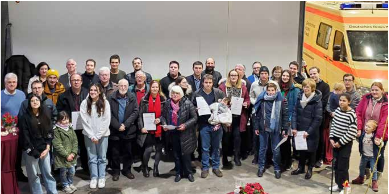
Mitgliederehrung / © DRK SV Aachen