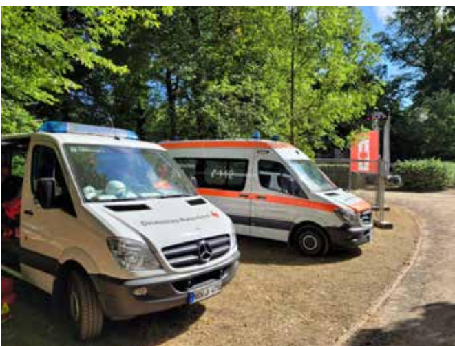
Einsatz bei den Aachener Kurpark Classix (unten und rechts oben) / © DRK SV Aachen

Nachdem die Kurpark Classix in den Jahren 2020 und 2021 der Corona-Pandemie zum Opfer gefallen waren, wurde der Kurpark am ehemaligen Aachener Casino im Sommer 2022 für mehr als eine Woche zur Bühne für unterschiedliche Konzerte und kulturelle Veranstaltungen. Die rettungs- und sanitätsdienstliche Versorgung wurde traditionell durch alle drei Aachener Hilfsorganisationen sichergestellt. Unsere Bereitschaft war – zum Teil mit Unterstützung aus der Rettungsdienst gGmbH – bei den Konzerten von Alvaro Soler und Silbermond im Einsatz. Auch die Veranstaltung „Classix for Kids“ haben wir wie gewohnt in Zusammenarbeit mit dem JRK betreuen können.