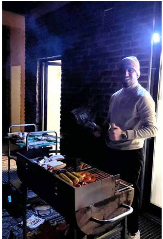
Dienstabende (rechts)

praktische Prüfung für den 'Bootsführerschein Binnen' bestanden.