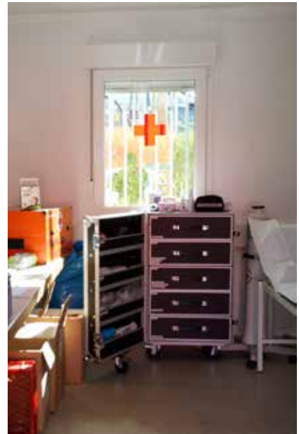
Einsatz auf dem Öcher Osterabend 2022