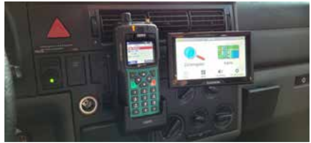
Einbau Navi- und Funkgerät in den T4