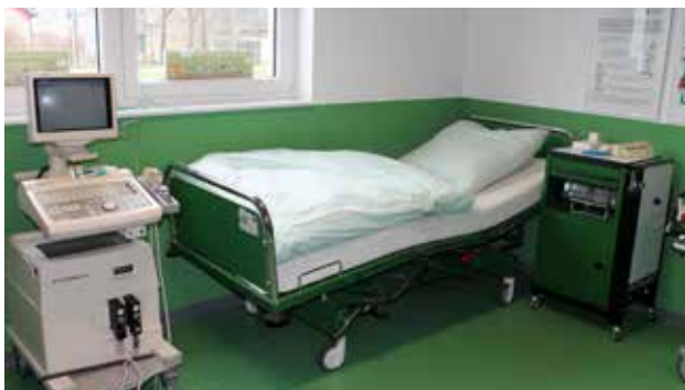
Innenansicht Teddykrankenhaus

Der Arbeitskreis "Teddykrankenhaus" führt seit Jahren Seminare für Kitas und Vorschulklassen in der Städteregion Aachen durch.