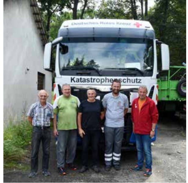
Hilfsgüterlieferung nach Jelenia Góra (unten und oben)

Tag eingeladen. Am Sonntagmorgen ging es dann gegen 9 Uhr wieder zurück nach Deutschland. Ankunft in Aachen war gegen 22:00 Uhr. Fazit des Wochenendes: 1.787 km Fahrstrecke in 26 Stunden (laut digitalem Fahrtenschreiber) und ein (nicht ganz klimaneutraler) Verbrauch von 605 Litern Diesel.