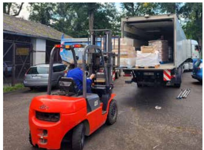
Hilfsgüterlieferung nach Jelenia Góra, Abladen in Polen

Nach 1,5 Stunden Schlaf im LKW wurde der Auflieger dann gemeinsam mit dem Polnischen Roten Kreuz ausgeladen. Im Anschluss ging es erst mal ins Hotel zum Relaxen. Die polnischen Kollegen hatten für ihre deutschen Gäste noch ein Sightseeing-Programm organisiert und übernahmen die Unterbringung im Hotel. Außerdem wurden unsere Helfer zum Mittag-, Abendessen sowie zum Frühstück am nächsten