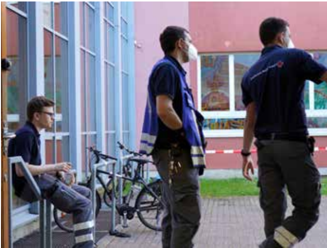
Einsatz Bombenfund in Aachen-Burtscheid

Einige Zeit später lieferte die Berufsfeuerwehr das vom Studierendenwerk Aachen zubereitete Essen, das in der Folge an die Betroffenen und die Einsatzkräfte ausgegeben werden konnte. Parallel zur Betreuungsstelle in der Luise-Hensel Schule betrieben die Johanniter, die ausserdem den Einsatzabschnitt Betreuung führten, eine separate Anlaufstelle für den Aufenthalt von an COVID19 erkrankten Betroffenen.