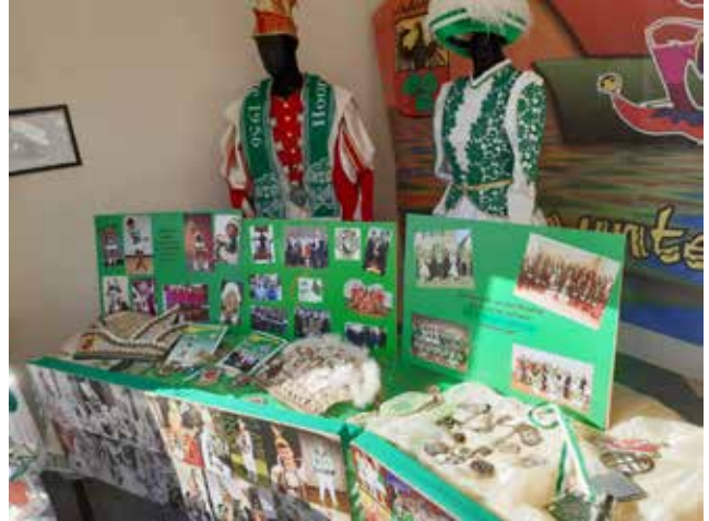
Ausstellung der Haarener Karnevalsvereine, Februar 2022